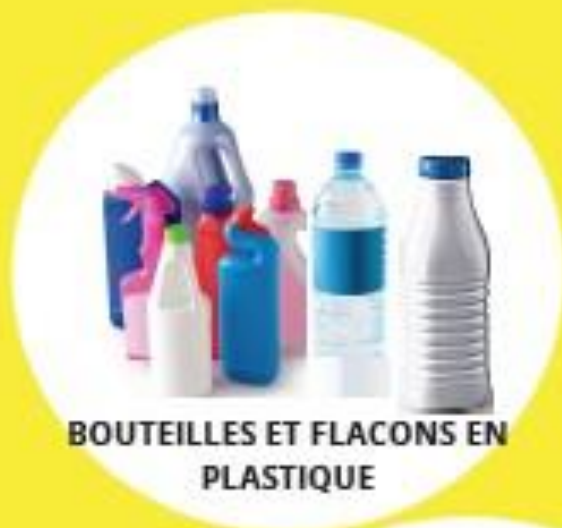
BOUTELLES ET FLACONS EN PLASTIQUE