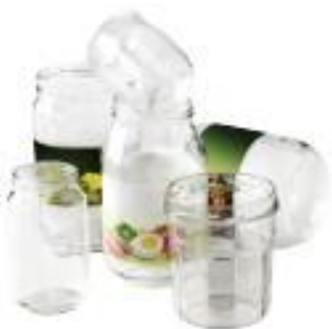
POTSET BOCAUX EN VERRE